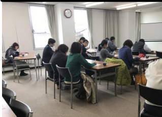
滑川商工会議所様