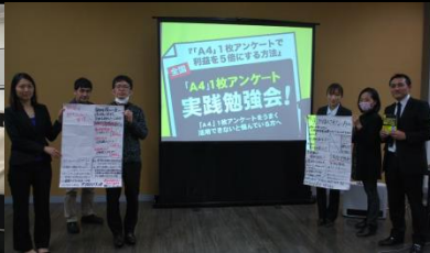
黒部商工会議所様