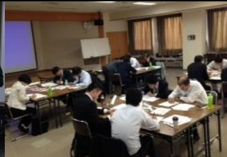
にいかわ信用金庫様